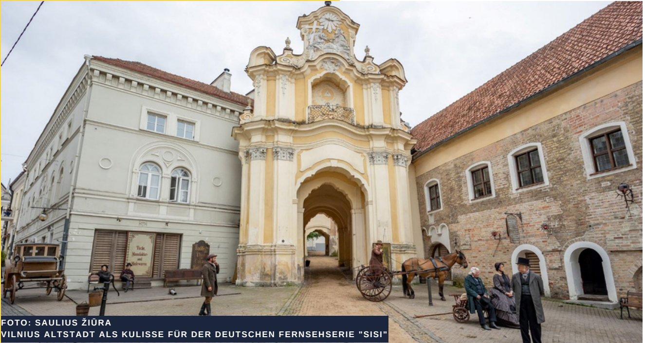
VILNIUS ALTSTADT ALS KULISSE FÜR DER DEUTSCHEN FERNSEHSERIE "SISI"